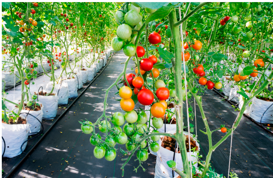
Figura 5 – Semi-hidroponia

mais desenvolvidos. Para isso, utilizam-se canaletes, sacos ou vasos cheios de substrato – tal como areia, perlita, lâ-de-rocha, turfa e fibra de coco. A solução nutritiva, por sua vez, é percolada através desse material e drenada pela planta por um sistema de rega por gotejamento. Este método é bastante utilizado na Europa, onde se diferencia por possibilitar a melhor utilização do espaço de cultivo (Figura 5).