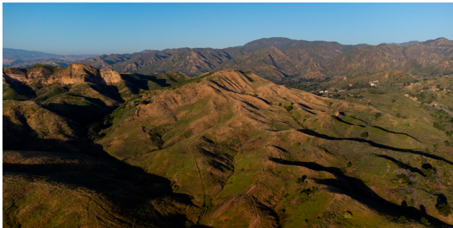
Figura 1 – Topografia acidentada ou montanhosa