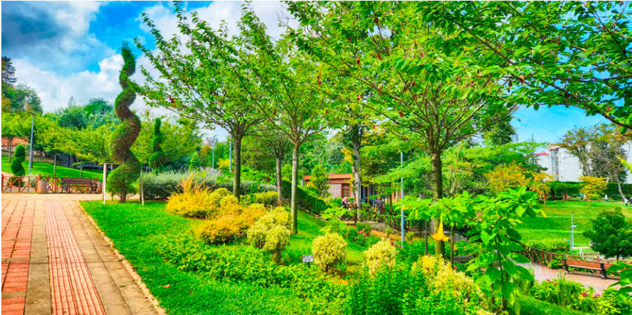
Figura 3 - Topografia ondulada

Em terrenos acidentados ou montanhosos, é necessário focar em espécies com raízes profundas e que suportem condições adversas, como solos rochosos e variações extremas de drenagem (Figura 3).