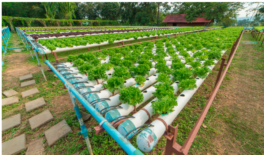
Figura 4 – Sistema hidropônico demonstrando o cultivo de vegetais sem o uso de solo

A hidroponia é uma técnica de cultivo sem a necessidade de solo ou substrato, amplamente utilizada para a produção de hortaliças e frutas. Nela, as raízes recebem uma solução nutritiva balanceada, composta por água e todos os nutrientes essenciais ao desenvolvimento das plantas. Neste método, as raízes podem estar suspensas em meio líquido ou apoiadas em substrato inerte (Figura 4).