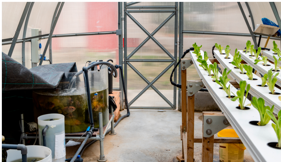
Figura 6 – Aquaponia